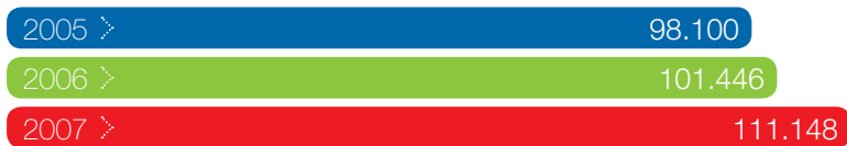
Servicios prestados por los Centros Fedit del sector Textil relacionados con la I+D+I. R&D&I related services provided by centers in the Textile sector

A lo largo de 2007, los Centros del sector Textil asociados a Fedit prestaron 111.148 servicios relacionados con la I+D+I, frente a los 101.446 de 2006 . En 2007 también se detectaron otros aumentos, como en el número de doctores y titulados superiores y medios a los que estos cuatro Centros Tecnológicos emplearon, que se situaron en los 257, frente a los 232 de 2006. El personal subcontratado, por su parte, aumentó de los 13 empleados de 2006 a los 118 en 2007. El número de becarios, por el contrario, experimentó un ligero descenso, pasando de los 13 de 2006 a los 9 de 2007. Esta disminución del número de becarios refleja que este colectivo es una fuente muy importante para la contratación de personal por los Centros Tecnológicos, que ha aumentado.