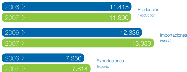
Evolución del sector Textil en España (Millones de euros). Evolution of the Textile sector in Spain (Millions of Euro).

El sector Textil representó el 7% del empleo, el 3,5% del producto industrial y el 5,3% de las exportaciones industriales españolas durante 2007. En ese mismo periodo, este sector vio cómo su producción se mantenía en unos valores muy similares a los del año anterior, alcanzando los 11.390 millones de euros y rozando de esta manera los 11.415 de 2006. Por otro lado, se realizaron importaciones por valor de 13.383 millones de euros, frente a los 12.336 de 2006. Las exportaciones, por su parte, crecieron de los 7.356 millones de 2006 a los 7.814 de 2007.