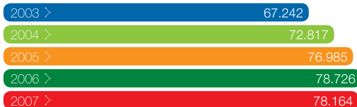
Evolución del sector Agroalimentario en España (Ventas netas millones de euros). Evolution of the Agro-Food sector in Spain (Net sales in millions of Euro).

La industria agroalimentaria española ocupa, según datos de cifra neta de negocio, el quinto puesto en Europa.