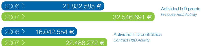
Evolución de los ingresos por actividades de I+D de los Centros Fedit del sector Agroalimentario. Evolution of Fedit Centers revenue from R&D activities in the Agro-Food sector

Los Centros de Fedit que realizan algún tipo de actividad relacionada con el sector Agroalimentario vieron en 2007 cómo sus ingresos crecían 20 millones de euros por encima de sus resultados de 2006. En concreto, como se ha mencionado anteriormente, obtuvieron 89.640.767 euros, frente a los 69.796.656 de 2006. Este crecimiento viene siendo constante durante los últimos años. Si profundizamos en esta cifra, se desprende que el 36% de esos ingresos, o lo que es lo mismo, 32.546.691 euros provienen de actividades de I+D propias, mientras que un 25% (22.488.272 euros) lo hacen de actividades de I+D contratada.